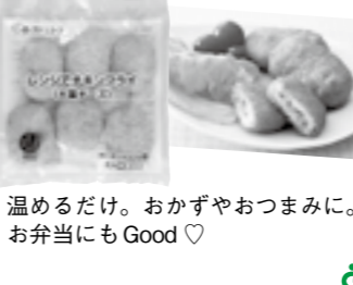
温めるだけ。おかずやおつまみに。お弁当にも Good ♡