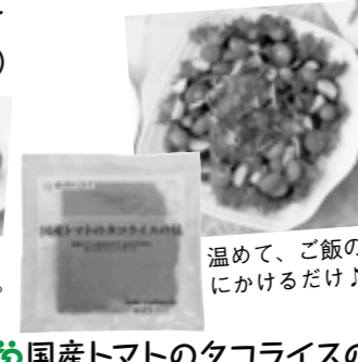
温めて、ご飯の上にかけるだけ♪