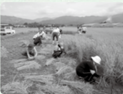
10月7日(土) MOA自然農法湯前普及会 県南地域委員会

当日は薄い雲のかかる爽やかなお天気に恵まれました。いもち病が少し出たとの報告もありましたが、心配するほどの影響はなく、春に皆で植えた水田には、ずっしりと実った金色の稲が一面に広がっていました。1束1束鎌で手刈りして、4束をまとめて結び、稲刈りの後は足踏み脱穀体験を行いました。子どもたちも生産者の方に手伝ってもらい、何度も挑戦していました。