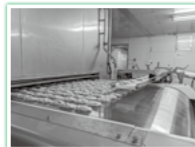
冷凍後、袋詰めします。