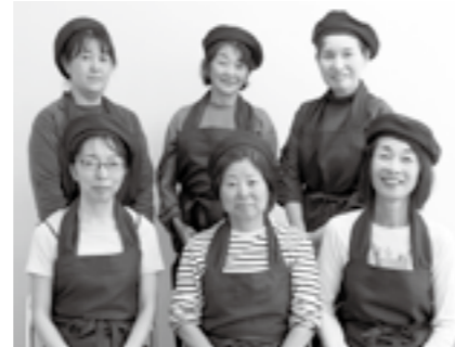
「食育の会わくわく」の皆さん

ワーカース・コレクティブ「食育の会わくわく」は、子ども料理教室をはじめ、「グリーンコープ商品利用普及教室」「リモート料理教室」にも取り組まれています。「子ども料理教室」ではグリーンコープならではの食育にこだわり、子どもたちに達成感や自信を持ってもらい、自己肯定感を育めるようにと、日々、技術の向上に努めておられます。