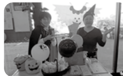
ハロウィン当日ということで仮装をしてお出迎え🎃

簡単なアンケートに答えてもらいながら、せっけんのことや福祉活動組合員基金(100円基金)、リニューアルするハムとソーセージのことについて、和やかにお話することができました。