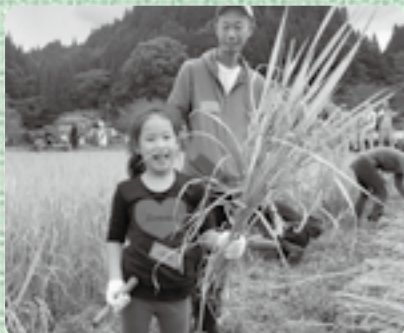
10月14日(土) JA阿蘇小国郷 鹿本・玉名地域委員会

無農薬で無施肥栽培、そして雑草も生かして、美味しいお米がこんなにたわわに実ることを学び、感動を覚えた稲刈りとなりました。