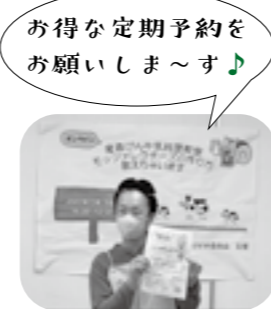
お得な定期予約をお願いしま～す♪