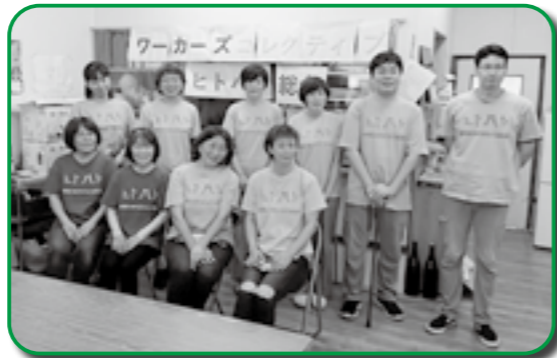
「ワーカーズコレクティブ ヒトハレ」の皆さん