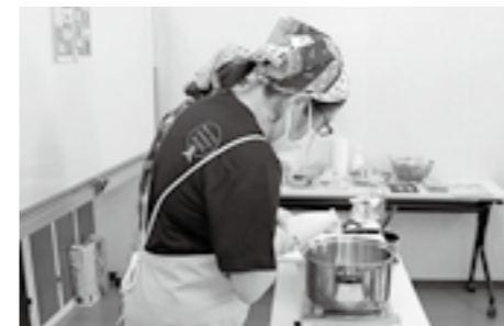
商品おすすめ活動委員会の「産直びん牛乳でチーズ作り」では、市販の牛乳との違いを知らせることもできました。

絶好のおまつり日和の中、昨年開催予定だった「グリーンコープ生協くまもと20周年」のお祝いを兼ねたまつりを「ましきスマイルいきいき館」(益城町寺迫)で開催しました。グリーンコープ商品のメーカー6社と2ヶ所の産直青果生産者、東地域本部のエリアにある3店舗をはじめ、災害支援センター、生活再生相談室などからも出店いただきました。当日の参加者は180人と、大盛況でした。