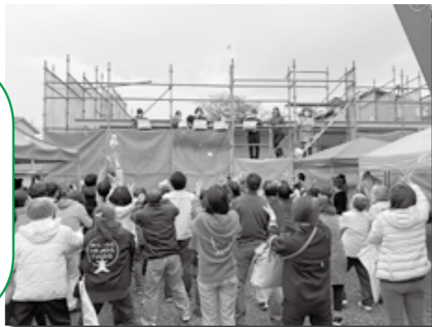
11月19日(土) 上棟式での餅投げの様子

泥まみれになったあの日(「令和2年7月豪雨」)から、やれることもやれないことも全員で全力疾走してきました。「ヒトハレハウス いっとこ」は皆さんの応援のおかげで、あと、あともう少しで完成です!