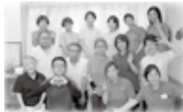
スタッフの皆さん