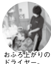
お風呂上がりのドライヤー。「気持ちいい」とご利用者さん。