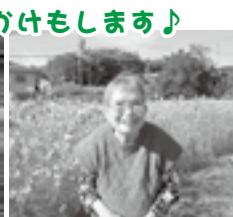
10月のコスモス見学。笑顔も素敵♪