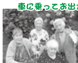
6月のアジサイ見学。少人数でのお出かけです。