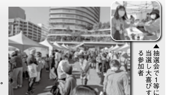
▲抽選会で1等にする参加者