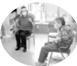
マンツーマン指導での機能訓練。